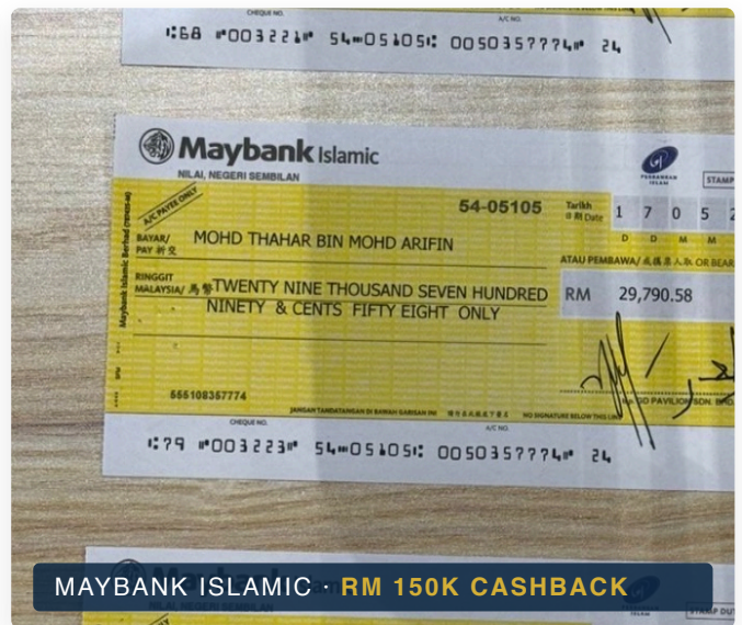
MAYBANK ISLAMIC · RM 150K CASHBACK